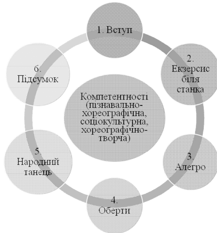
Рис. 1. Зміст програми індивідуальних занять

Зміст програми індивідуальних занять з вихованцями Театру народного танцю “Барви” для усіх 4 років навчання відображено за такою структурно-логічною схемою і являє собою інформаційно-дидактичну модель навчальної діяльності вихованців дитячого хореографічного колективу (рис. 1).