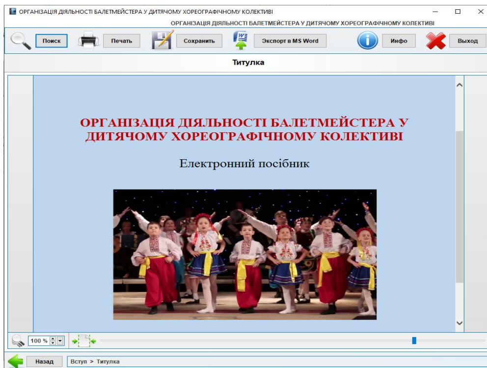
Рис. 3. Електронний посібник

навчально-виховного процесу вихованців дитячого хореографічного колективу. З метою дидактично обґрунтованого структурування навчального матеріалу електронний посібник складається з таких сторінок: титульної, сторінки вступу, сторінок двох розділів (містить сторінки підрозділів), загальних висновків, списку рекомендованої літератури, сторінки методів виховної роботи, основ класичного танцю, словника хореографічних термінів, системи довідки, пошуку, можливості експорту матеріалів сторінки у Word та інтерактивних складників, звернення до яких можливе з будь-якої сторінки. За своєю ж суттю зміст електронного посібника відбиває слушні поради для викладачів (балетмейстерів) з метою підвищення ефективності організації навчальної діяльності вихованців дитячого хореографічного колективу.