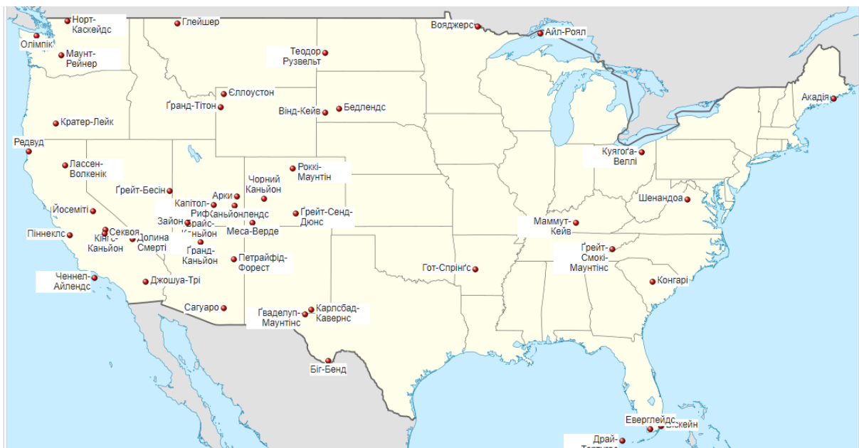
Рис. 1. Національні парки США

З рис. 1 можемо побачити Національні парки США. У той же час, брами парків відкриті усім і більш ніж 270 мільйонів відвідувачів щороку, американців і багато іноземних туристів, приїждять у будь-який Національний парк з метою відвідувати та оглядати свою землю; знайомляться з тим, які люди і якими засобами зберегли все це через століття.