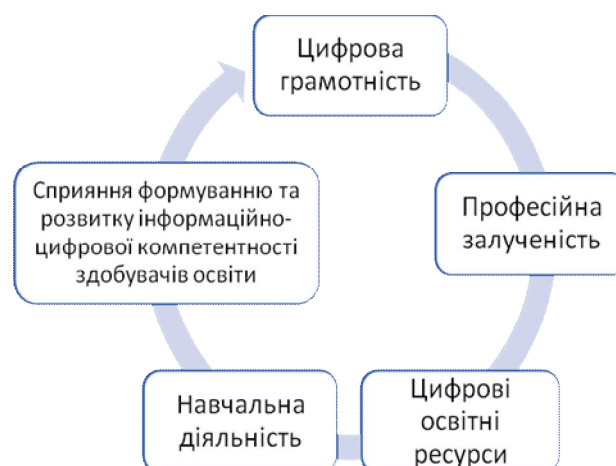
Рис. 2. Сфери цифрової компетентності педагогічних та науково-педагогічних працівників

У цьому документі визначено критерії визначення рівня володіння