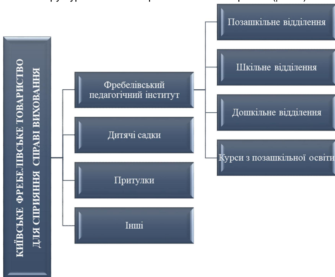
Рис. 2. Структура Київського Фребелівського товариства

Проаналізувавши статuti товариства та інші архівні матеріали, нами узагальнена структура Київського Фребелівського товариства (рис. 2).