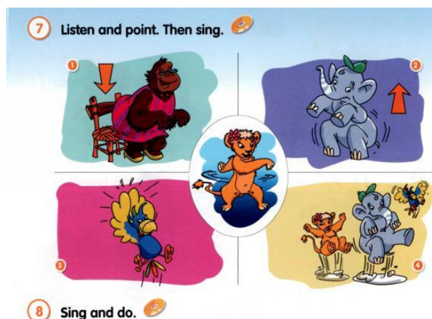
Рис. 4. Приклад вправи на розвиток мовленнєвої навички

У підручнику Fly High пропонуються транскрипційні знаки одночасно з літерами, тож наочністю можуть бути транскрипційні знаки. Ознайомивши учнів з кількома літерами, звуками та римівками, слід запропонувати їм спершу обрати відповідні літери та звуки до малюнків (скориставшись магнітною дошкою), а тоді продекламувати римівку. Наступним етапом може бути написання букв та звуків. Наприклад: на дошці малюнок з бджілкою на дереві, що п'є чай. З вивчених транскрипційних знаків діти вибирають [i:] та прикріплюють на дошці під малюнком, серед літер алфавіту знаходять Ee та прикріплюють нижче, називають слова з цією літерою з римівки (bee, tree, sea, tea) і декламують римівку: