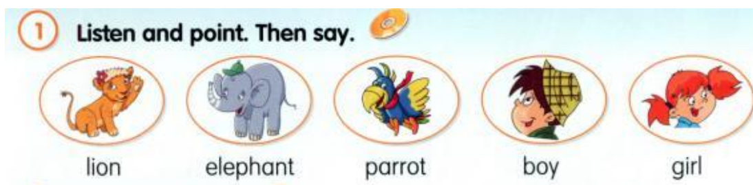
Рис. 1. Приклад вправи на ознайомлення з лексичним матеріалом із використанням наочності

Розглянемо детально використання наочності під час викладання англійської мови за підручником із НМК "Fly High". Вивчення теми "In the jungle" починається з таких завдань: Listen and point. Then say. Учні, маючи перед собою зоровий образ тварин, чують ще й звуки, які вони видають (див. рис. 1):