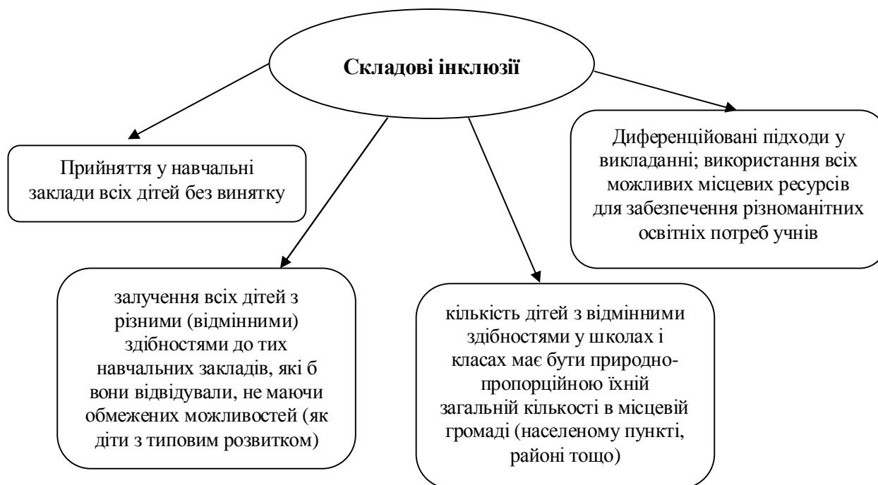
Рис. 1.2. Складові інклюзії. [1, с. 39]

На основі наукової літератури А. Колупаєва визначає основоположні складові інклюзивної освіти, які зображено нами схематично (рис. 1.2).